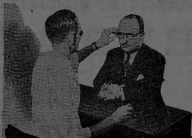
PREPARACION DE RECETAS DE OCULISTAS

"...Es de necesidad para la salud visual usar anteojos indicados por un profesional"