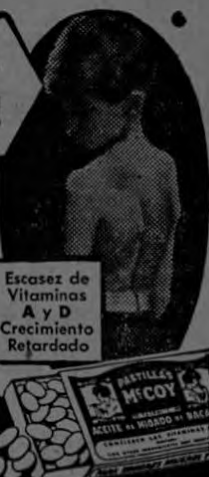
Excesos de Vitaminas A y D Crecimiento Retardado