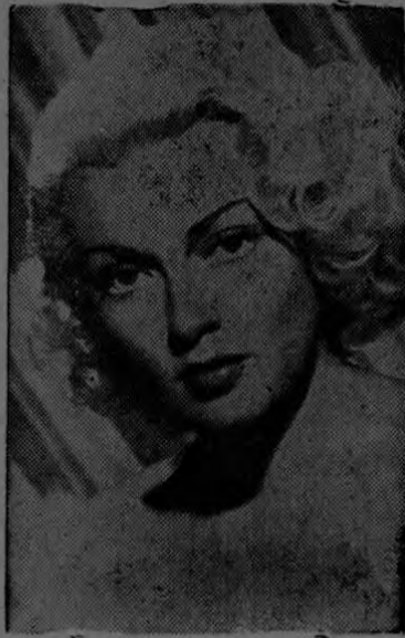
Según afirma Max Factor Jr., el famoso experto de Hollywood, las famosas bellezas de la capital del cine, como Lana Turner, estrella de la Metro Goldwyn Mayer, nunca se estropean las aplicaciones de lápiz de labios con la desagradable costumbre de mordérselos.

brillo para los labios, aplicado sobre el lápiz de labios, posee propiedades lubricativas que ayudan a mantener los labios suaves y sin cortaduras en circunstancias normales. Además, el brillo puede aplicarse atractivamente en mayor cantidad de la que jamás podría aplicarse el lápiz de labios.